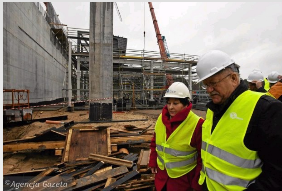
Budowa spalarni śmieci na terenie BPPT